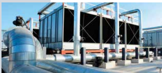
ELECTRICITÉ DU CVC Chauffage - Ventilation - Climatisation