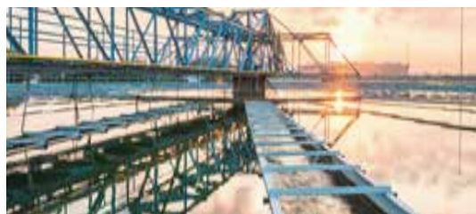
MÉTIER DE L'EAU